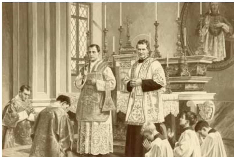
30 de Julio, 1860, “Primera Misa” de Don Rua.

Miguel Rua ponderaba los sabios consejos de Don Bosco y hacía de ellos su regla de vida.