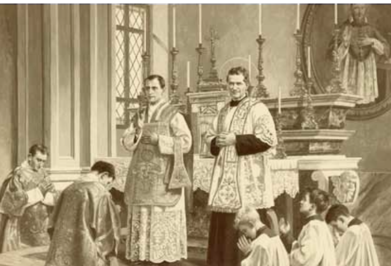
July 30, 1860, "First Mass" of Don Rua.

Michael Rua pondered Don Bosco's wise counsels and made them a rule of life.